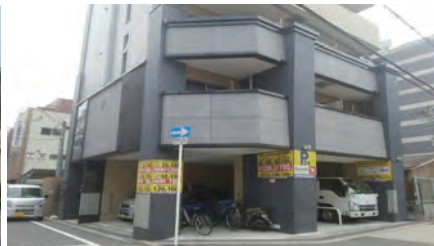
マンション駐車場の空きスペースを有効活用