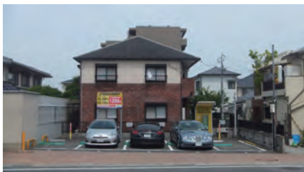
家の庭の一部をコインパーキングとして有効活用