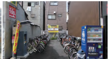
狭小地をコイン駐輪場として有効活用