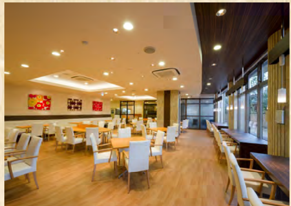
人気のレストラン“AJIICHIBA” 一般のお客様も召し上がれます。