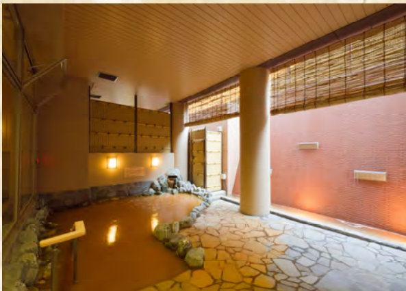
地下1, 500mからの恵み 天然温泉「琥珀の湯」